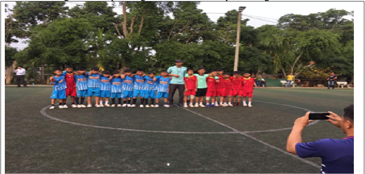
Thi đấu giao hữu bóng đá mini với trường Tiểu học Hoàng Văn Thụ